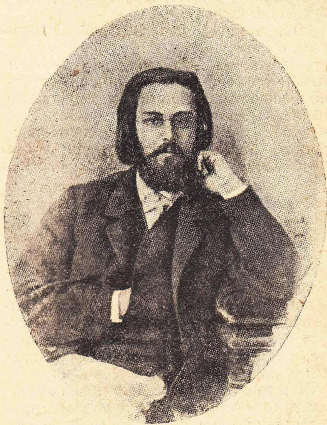
Василий Алексеевич Слепцов

Этот однотомник должен будет явиться, так сказать, первым опытом «воскрешения» в общественной памяти «забытых имен» классиков. Не ограничиваясь им, издательство предпринимает еще ряд шагов в том же направлении, одним из которых будет уже сейчас намечающийся однотомник «Беллетристы-семидесятники». И хронологически, и по манере тогдашнего художественного письма, и отчасти идеологически эпоха 60-х и эпоха 70-х годов так близко соприкасались одна с другой, а участь писате-